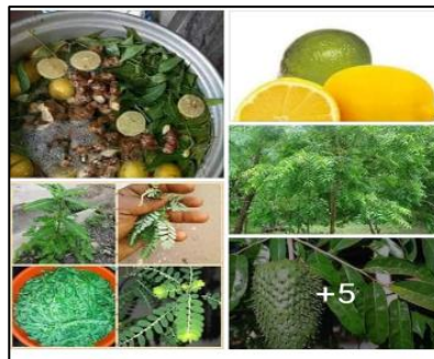
Image 2 : Décoction et diverses plantes et fruits utilisés dans la médecine traditionnelle africaine

La capture suivante est aussi significative de ce désir de faire l'apologie des remèdes d'Afrique.