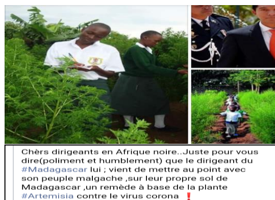
Image 4 : Interpellation faite aux dirigeants d'Afrique noire à suivre l'exemple malgache